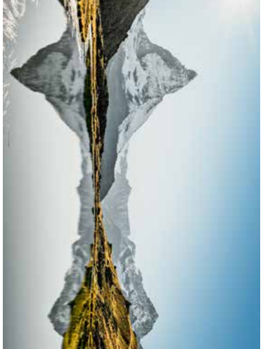
demart, das aber schon zum Kanton Uri gehört, lohnt es sich, diese Gegend rund um Leuk und Pynwald zu erkunden. Da hätten wir auch noch die Waldfläche oberhalb von Visp, die vor über zehn Jahren abbrannte und heute für Naturschönhe viele Überraschungen bereithält, aber das ist eine andere Geschichte.

hoch, übrigens ein Ort mit einem berühmten Literaturfestival, werden die vielen grossen Parabolantennen über Leuk auffallen. Für die einen ein Schandfleck, für die anderen eine Kränze für den nächsten Bondfilm. Noch immer wird getätselt, welche Funktionen diese Dinger haben und wer sie braucht. Zum Sammeln von Frischwasser wie ein Busfahrer es den Touristen mit Augenwinkeln sagte, sind sie wohl nicht. Die ersten Antennen stammen aus den