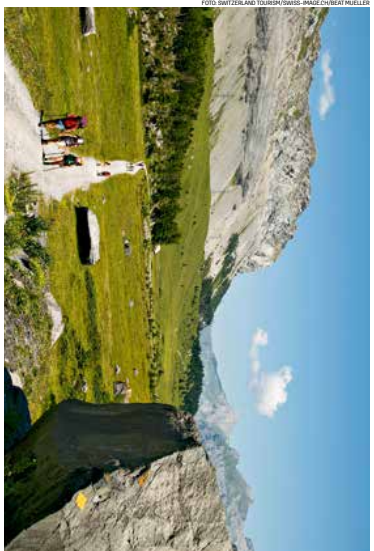
Wem es im Tal zu eng wird, den entschließt eine aussichtsreiche Wanderung auf die Gemmi wie auf der Via Cook zwischen Leukerbad im Wallis und Kandersteg im Berner Oberland.

Promotion - Magazin von Abilinger Gärter