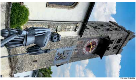
Ein eiserner Wächter vor der Pforte St. Stephan in Leuk-Stadt.

Ein Wald von nationaler Bedeutung Das zehn Quadratkilometer grosse Naturschutzgebiet von nationaler Bedeutung zwischen Leuk und Siders fasziniert durch den Reichtum an Tier- und Pflanzenarten, aber auch durch die sehr unterschiedlichen Formen und Gebiete, die geprägt wurden von Murgängen, Waldabänden und Überflutungen durch die Rhone. Im höheren Bereich ist der Wald dicht und dunkel, und man wandert sich nicht, dass hier früher Wegedäger ihr Schwesen trübten. Unten im Tal am Fluss