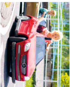
In ihren ersten Filmerschein machen Kinder in der Kinder-Verkehrsschule der ADAC-Striftung ihren ersten atembewusstbehaltenen Fahrpass in der Grundrolle-Kugelbahn.

Das Ravensburger Spieleland begeistert die ganze Familie.