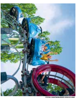
«Das verrückte Labyrinth» und die Kakerlake-Riesen-Schaukel warten darauf entdeckt zu werden.

Im Freizeitpark am Bodensee erleben kleine und grosse Abenteuerer unvergessliche gemeinsame Momente. Mitteln im Gärten heisst es hier: Mitmachen. Neues erfahren und spielerisch dazu lernen. Mit der Gravitrax-Kugelbahn erlebt ihr Fahrpass auf 90 Schienenmeter und werdet selbst zur rasenden Kugel. Die schönsten Spieldien von Ravensburger wie